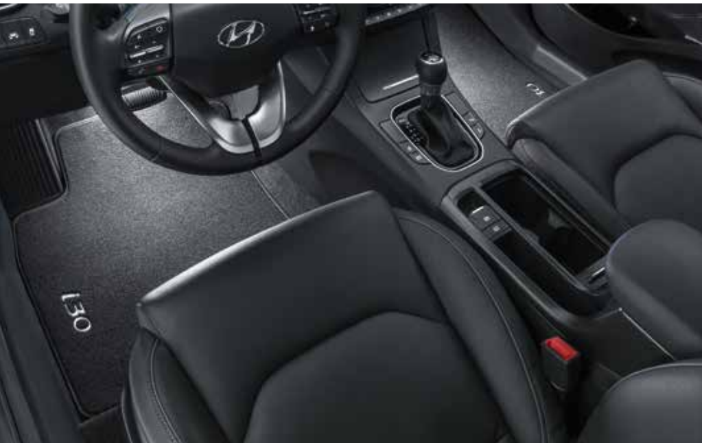
LED-es lábtérvilágítás, fehér, első sor

Vadonatúj autójának bensőséges, időtálló formáit olyan tartozékok kiválasztásával emelheti ki még jobban, amelyek egyszerre stílusosak és gyakorlatiasak.