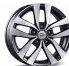
Könnnyűfém keréktárcsa 16"