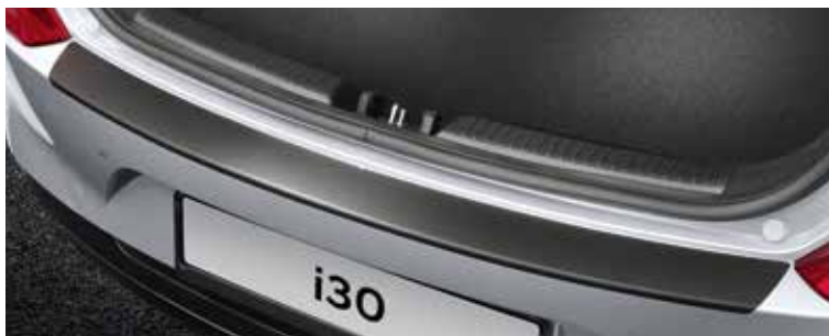
Hátsó lökhárító(rakodás)védő, fekete (ötajtós)