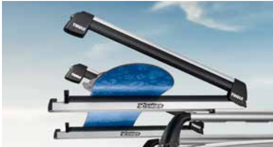
Xtender síléc- és snowboardtartó