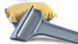
Téli autóápolási készlet