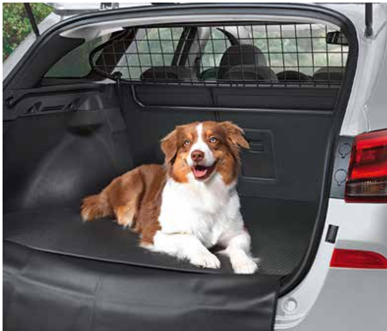
Csomagtér-elkülönítő, felső keret

Masszív tartozékok segítenek magunkkal vinni mindent, ami kalandjainkhoz kellhet.