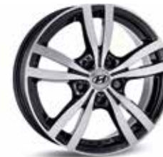
Könnnyűfém keréktárcsa 16 Asan"