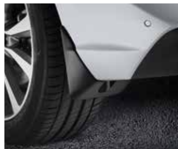
Sárfogó szett, hátsó