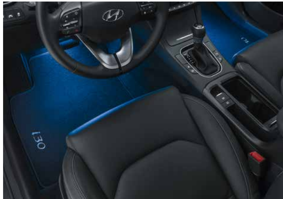
LED-es lábtérvilágítás, kék, első sor