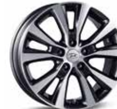
Könnnyűfém keréktárcsa 16"