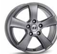
Könnnyűfém keréktárcsa 15" Mabuk Könnnyűfém keréktárcsa 16" Mabuk