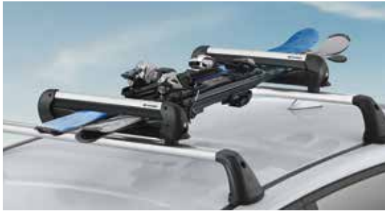
Síléc- és snowboardtartó - 400-as