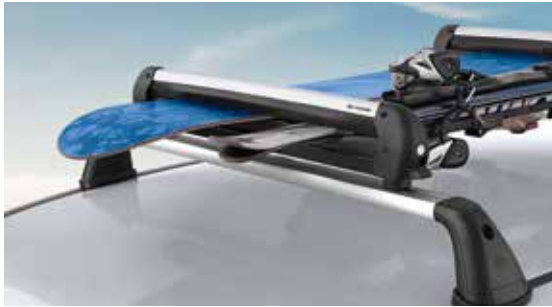
Síléc- és snowboardtartó - 600-as