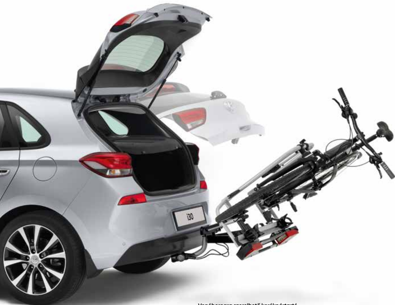
Vonóhorogra szerelhető kerékpártartó