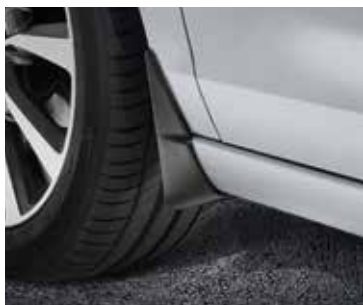
Sárfogó szett, első