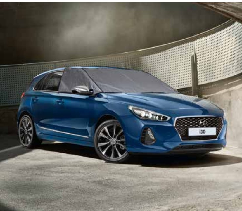
Jegesedés és napsugárzás ellen védő takaró

Praktikus és ötletes megoldások, amelyek minden utazást kényelmesebbé és otthonosabbá tesznek mind az Ön, mind az utasai számára.