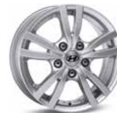
Könnnyűfém keréktárcsa 15" Asan