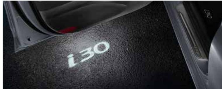
LED-es ajtóvilágítás, i30-logó

99651ADE99 (kiegészítő kábelkészlet intelligens kulcs nélküli gépkocsikhoz)