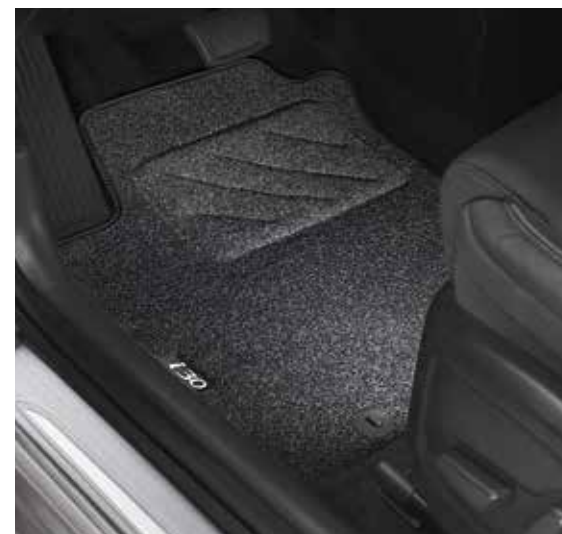
Textil lábszőnyeg, alap