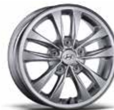
Könnnyűfém keréktárcsa 15"