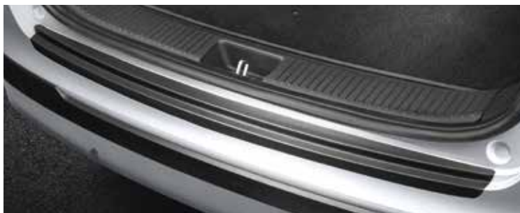
Hátsó lökhárító(rakodás)védő, fekete (kombi)