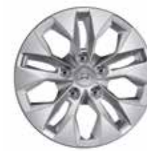
Acél dísztaercsa 15"