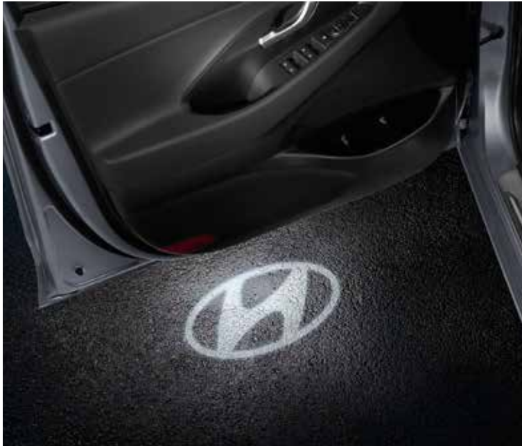
LED-es ajtóvilágítás, Hyundai-logó