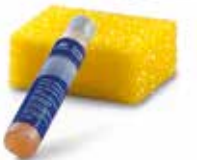
Nyári autóápolási készlet