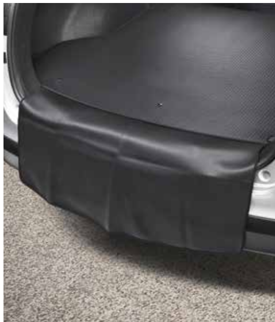
Kihajtható, megfordítható csomagterperem-védő (csomagtérszőnyeggel használható)