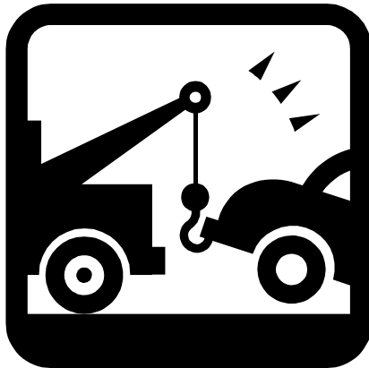
B. Gépkocsi szállítás/vontatás a legközelebbi Hyundai márkaszervizig