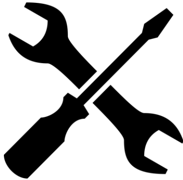
A. Helyszíni javítás